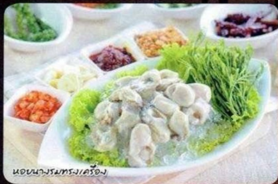
หอยนางรมทรงเครื่อง