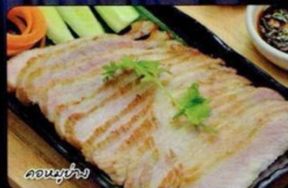
คอนหูนึ่ง