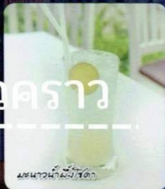
มะนาวน้ำผึ้ง/โซดา