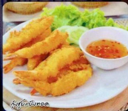
กุ้งนุ่มแป้งทอด