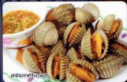
หอยแครงเผา