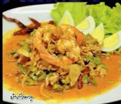
ยำถั่วพู