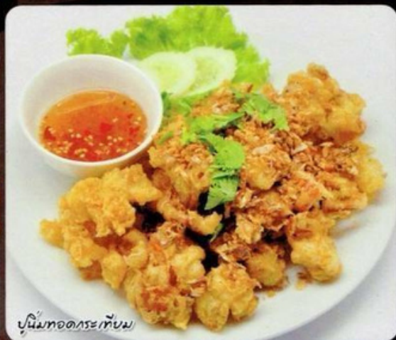
ปูนุ่มทอดกระเทียม