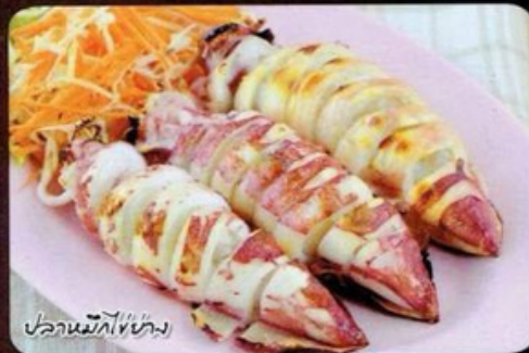
ปลาหมึกย่าง