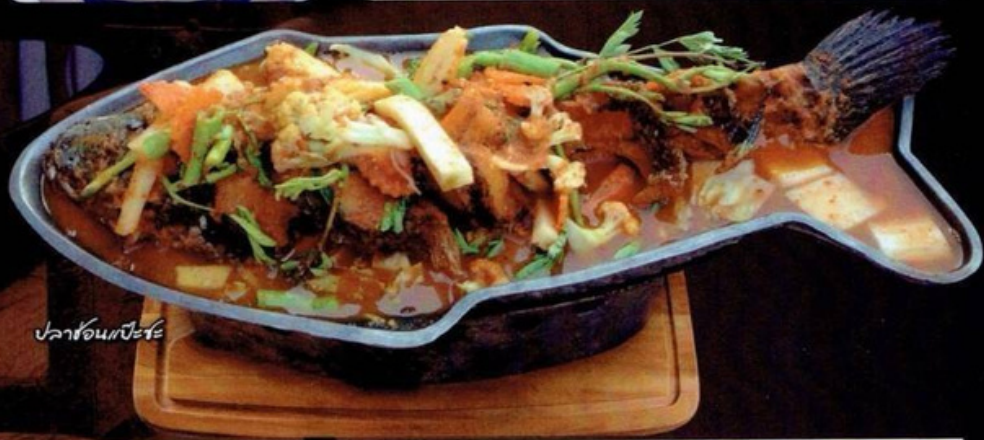
ปลาช่อนแป๊ะชะ