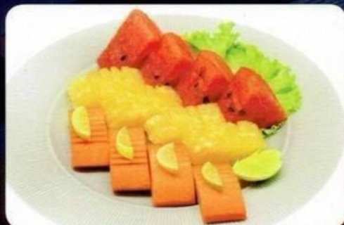
ผลไม้ (เล็ก, ใหญ่) 80/100.- Mix Fruits (S, L)