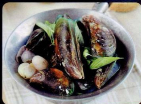
** หอยแมลงภู่นิวซีแลนด์ อบหม้อดิน Steam Sea-Mussels with Herbs