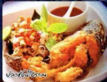
ปลาช่อนโบราณ