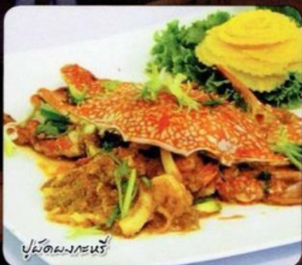
ปูนิ่มผัดผงกะหรี่