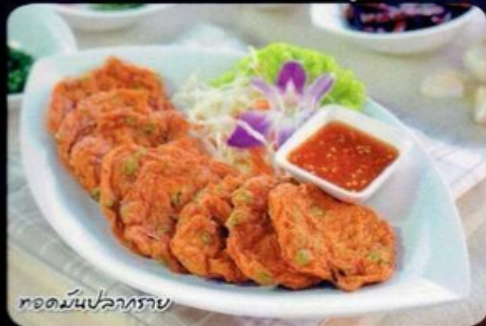
ทอดมันปลาทราย