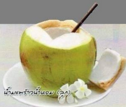
น้ำมะพร้าว น้ำหอม (ลูก)