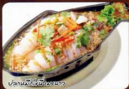
ปลานึ่งมะนาว