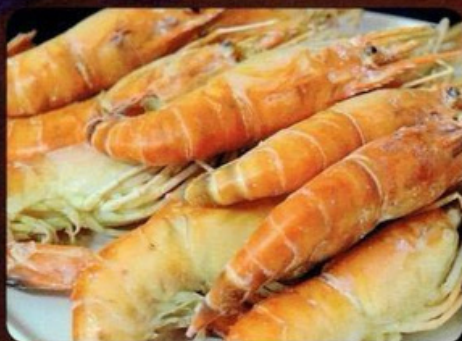
** กุ้งอบเกลือ Steam Prawns with salt