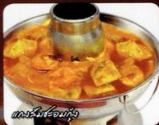
แกงส้มระอมกุ้ง