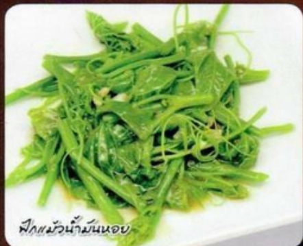
พืดแ้วน้ำมันหอย