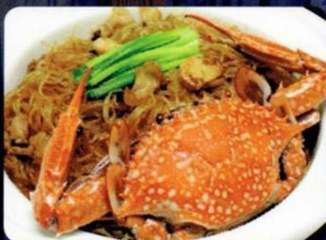
ปูม้าอบวุ้นเส้น Steam Crab with glass noodles