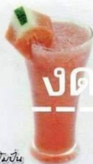
แตงโมปั่น