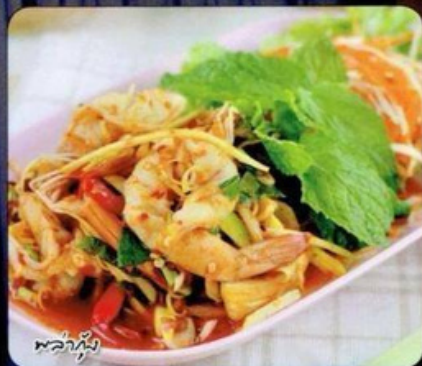
พริกน้ำส้ม