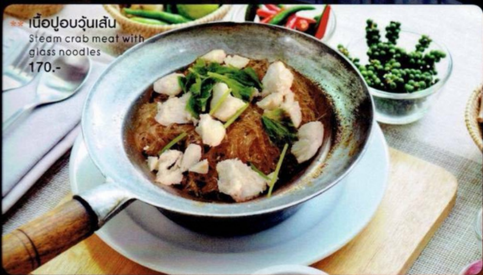
** เนื้อปูอบวุ้นเส้น Steam crab meat with glass noodles 170.-