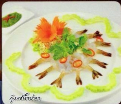
กุ้งแช่น้ำปลา