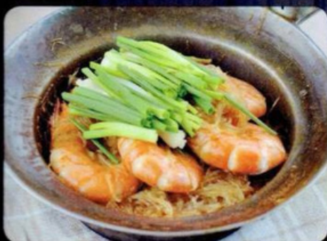
** กุ้งอบวุ้นเส้น Steam Prawns with glass noodles