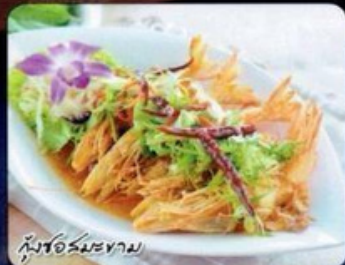
กุ้งชอสมะขาม