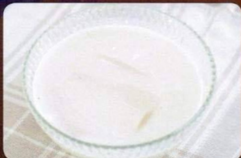
เต้าฮวยนมสด 35.- Coconut Pudding with milk