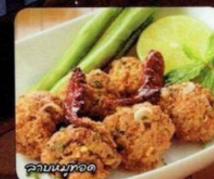
ลาบหมูทอด