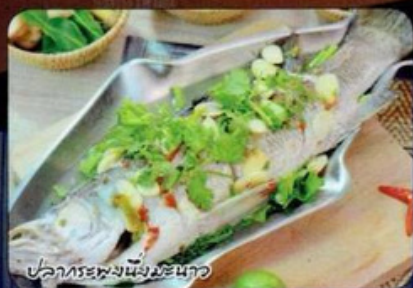
ปลากระพงนึ่งมะนาว