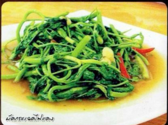
ผัดทะเลเจตไฟแดง