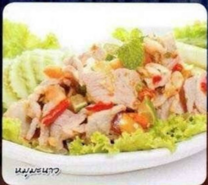
หมูมะนาว