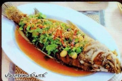
ปลากระพงสามรส