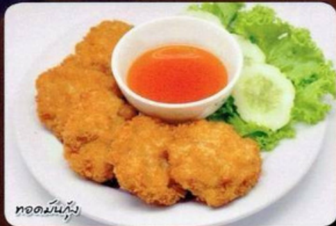
ทอดมันกุ้ง