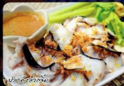
ปลาทับทิม