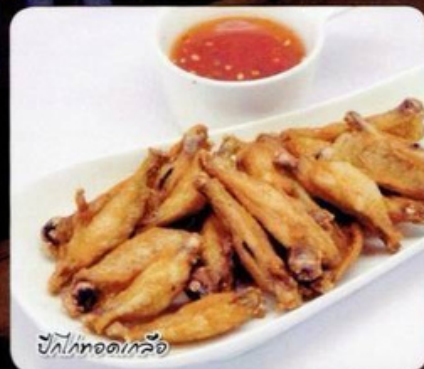
ปีกไก่ทอดเกลือ