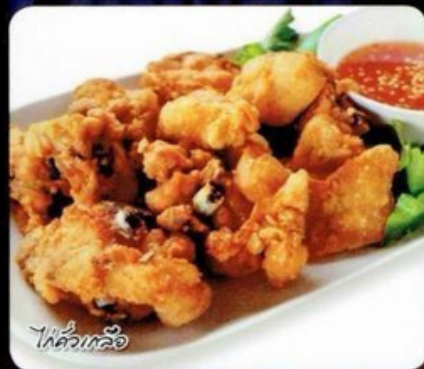
ไก่ทอดเกลือ