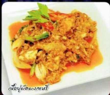
เนื้อปูผัดผงกะหรี่