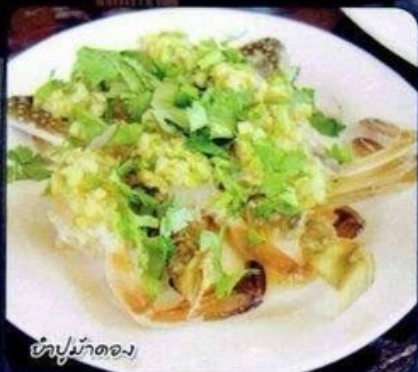
ยำปูม้าดอง