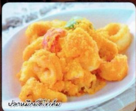
ปลานหมึกพืดไข่เค็ม