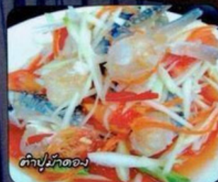
ตำปูม้าคั่วหอม