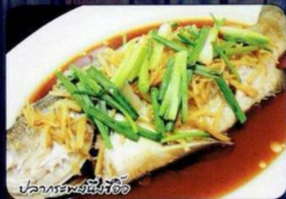
ปลากระพงนึ่งซีอิ้ว