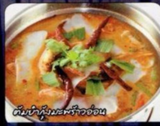
ต้มยำกุ้งมะพร้าวอ่อน