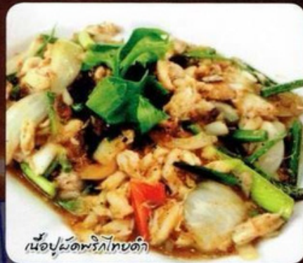
เนื้อปูผัดพริกไทยดำ