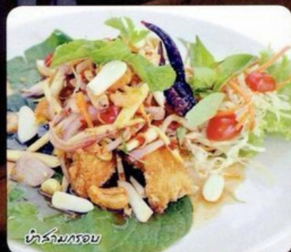
ยำคางคกรอบ