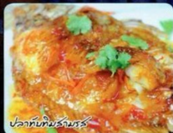
ปลาทับทิมสามรส