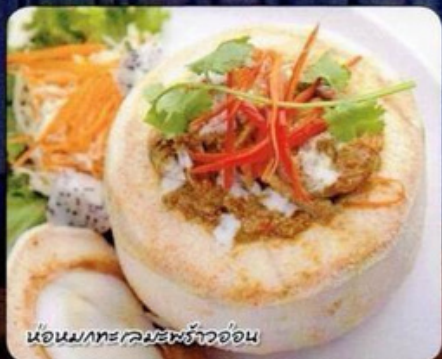
ห่อหมกทะเล:พริ้วอ่อน