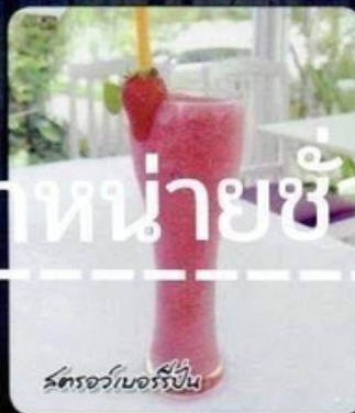
สตอว์เบอร์รี่ปั่น