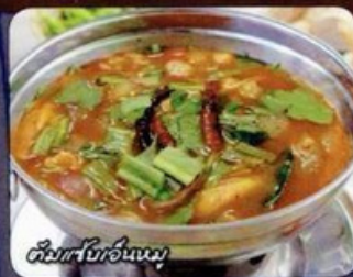
ต้มยำใบอ่อนหมู