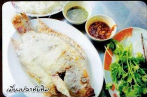
เมี่ยงปลาทิมทิม