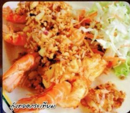
กบทอดกระเทียม