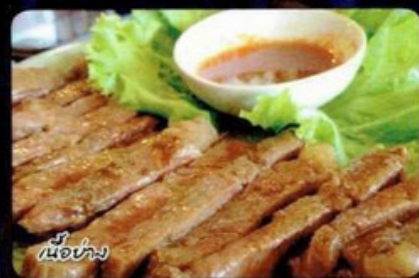
เนื้อย่าง