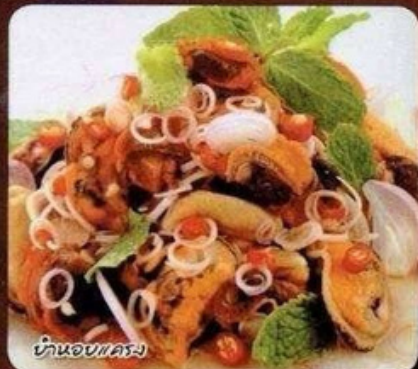
ยำหอยแครง