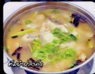
ต้มยำปลาคัง