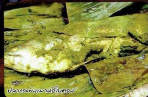
ปลากระพงเผาใบตอง