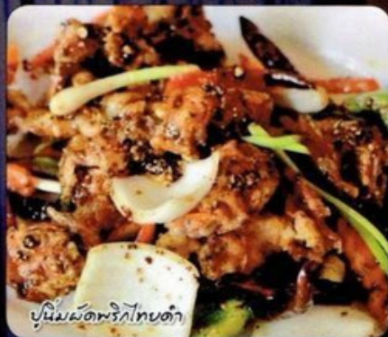
ปูนิ่มผัดพริกไทยดำ