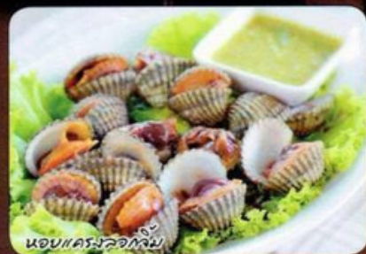
หอยแครงลวกจิ้ม