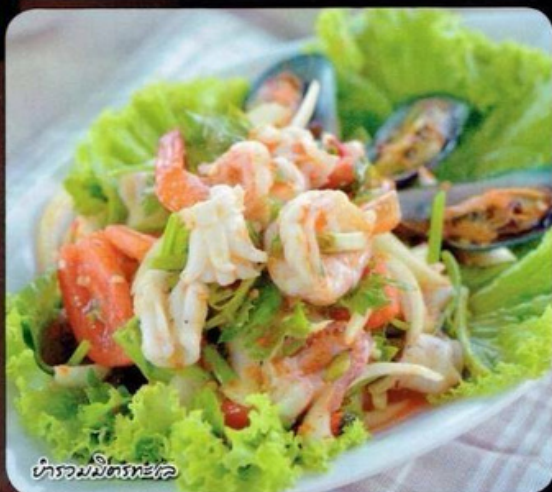
ยำรวมมิตรทะเล