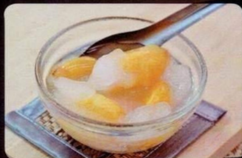
สละลอยแก้ว 45.- Sala in Syrup