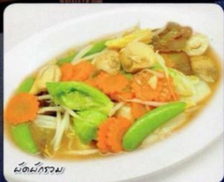
พืดผักรวม