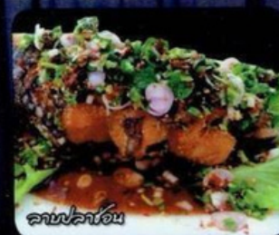
ลาบปลาร้า