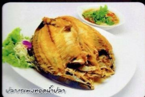
ปลากระพงทอดน้ำปลา